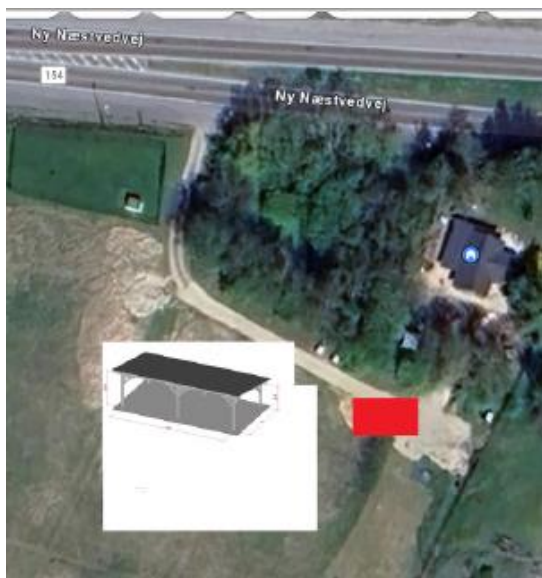
Figur 2: Carportens omtrentlige placering på grunden.