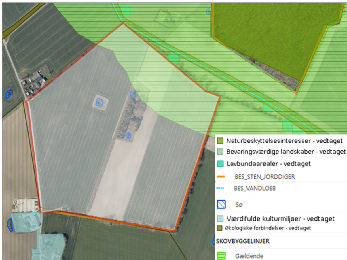
Plan- og projektområdet med udpegninger og bindinger. (Midlertidigt layout)