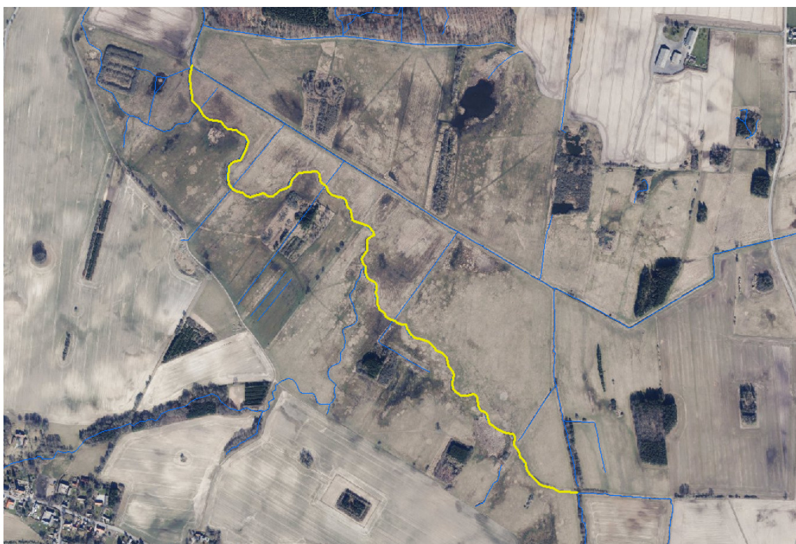
Kort over projektstrækning, som er markeret med gul. Andre vandløb ses med blå.

I Naturstyrelsens projekt blev det skrevet, at den genslyngede strækning ikke havde behov for grødeskæring efter projektet udførelse i det man vurderede, at vandløbet i høj grad kunne vedligeholde sig selv. Det tidligere vandløbsprofil blev grødeskåret to gange årligt.