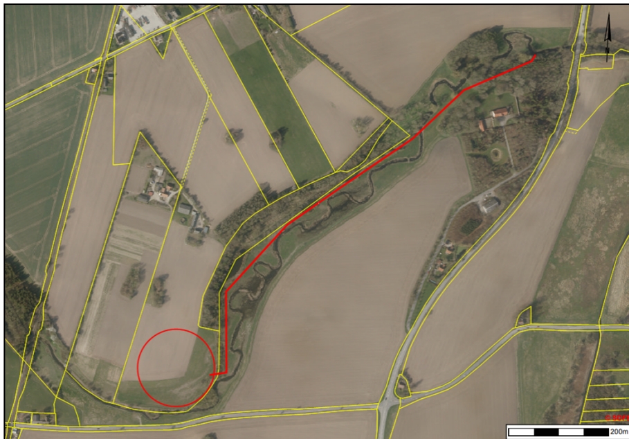
Figur 2: 2018 luftfoto. Den røde cirkel markerer området, der er drønet på matrikel 1g Ll. Linde By, Hårlev ifm. projektet vedr. genslyngning af Tryggevælde Å. Den røde linje markerer rørledningen på matrikel 1a Tryggevælde Hgd., Karise, der leder drønevandet til udløb i Tryggevælde Å. Matrikelskel er angivet ved de gule streger. Målestok er angivet i nederste højre hjørne.