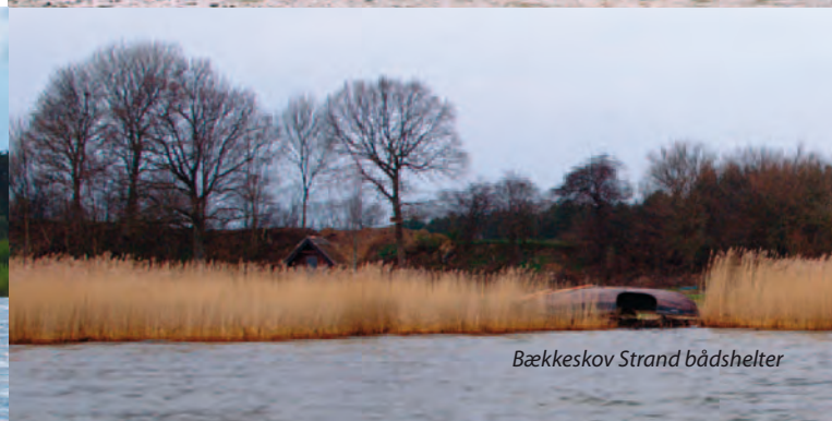
Bækkeskov Strand bådshelter