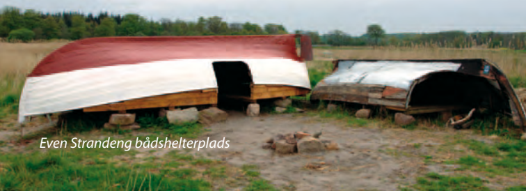
Even Strandeng bådshelterplads