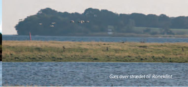
Gæs over strædet til Roneklint