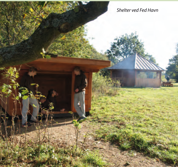
Shelter ved Fed Havn

Nærværende guide Præstø Fjord – fra søsiden viser hvor og hvordan du kan færdes på fjorden – og hvor du kan gå i land.