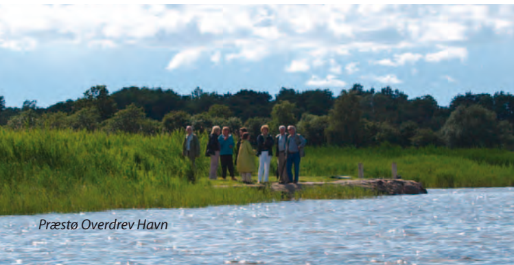
Præstø Overdrev Havn