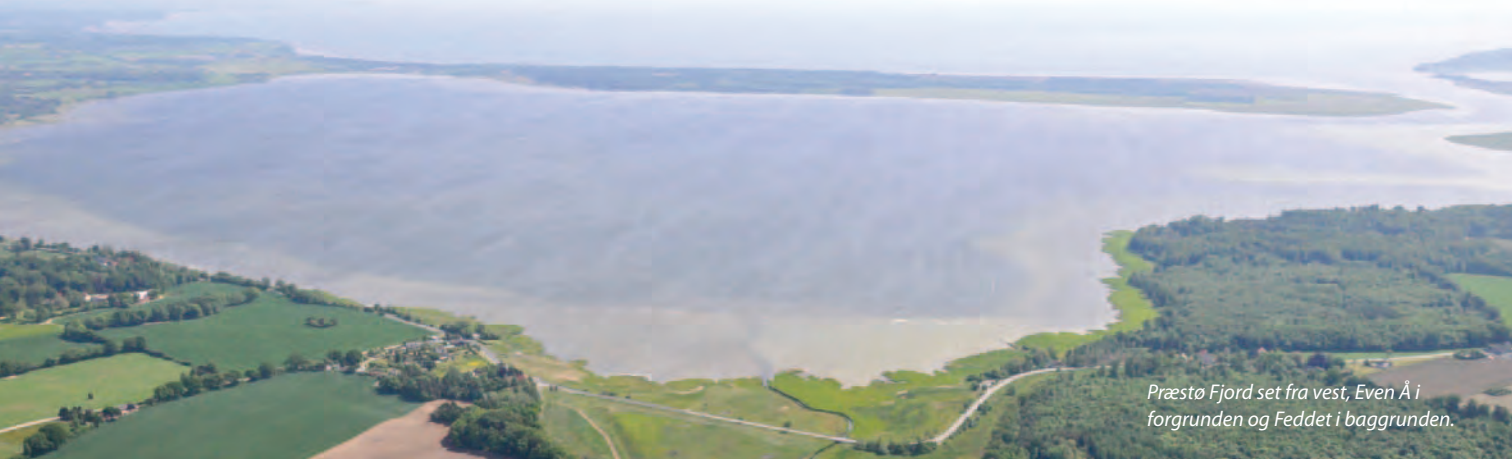
Præstø Fjord set fra vest, Even Å i forgrunden og Feddet i baggrunden.