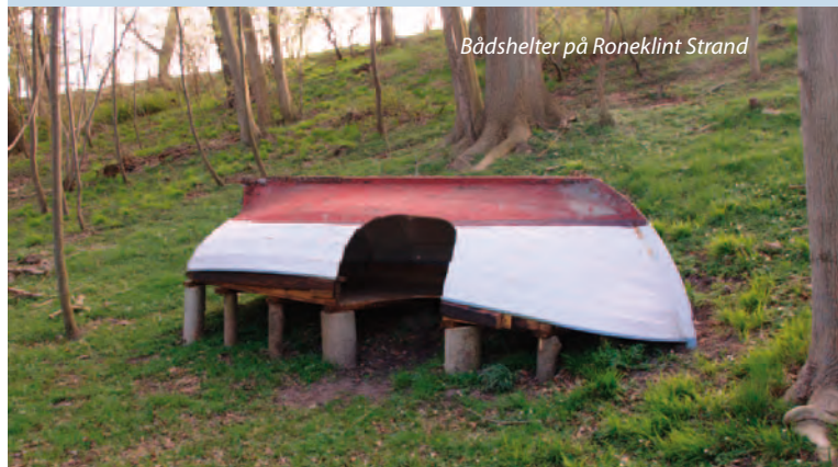
Bådshelter på Roneklint Strand

Når TUREn går tilbage mod Præstø, skal der af hensyn til fuglelivet ros/padles nord om øen Maderne . Turen ind mod Præstø er storslået, og du kan kun glædes over vildtreservatets mangfoldige fugleliv.