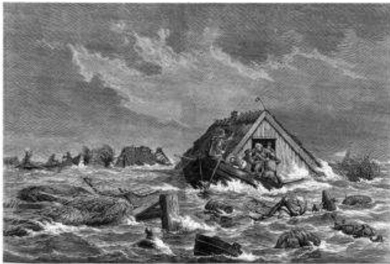
Dramatisk billede fra Lolland

Det var ufattelige skader og tab af menneskeliv, som vandet efterlod. Alene på strækningen fra Amager til Møn strandede omkring 112 skibe, og mere end 60 søfolk omkom.