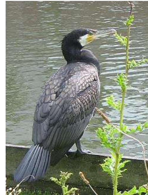
Tekst og billeder: Flemming Alrune Layout: Anette Munck April 2012

Det er fiskeren, der har været her længe før, mennesket kom og ville fiske.