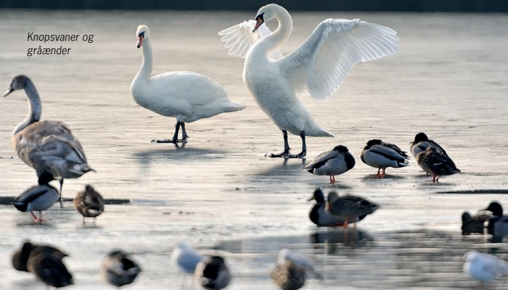
Knopsvaner og gråænder

Hvis isen lukker hele fjorden, vil den sidste våge være omkring sydvestspytten af Feddet. Når den lukker, vil fuglene flytte ud til vågerne i Faxe Bugt.