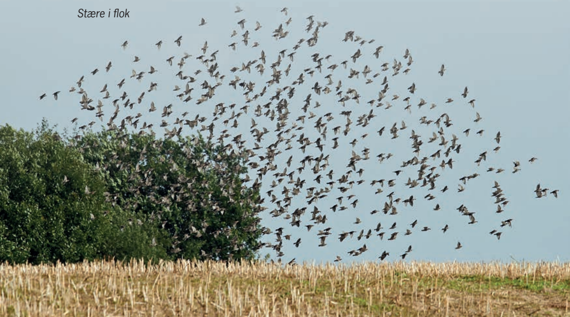
Stære i flok

På de næste sider vil fugletrækket blive beskrevet.